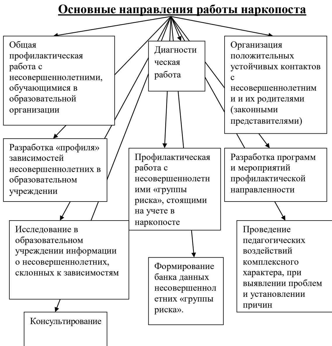
Рис. 2. Основные направления работы наркопоста

5) Работа наркопоста осуществляется по основным направлениям (Рис.2)