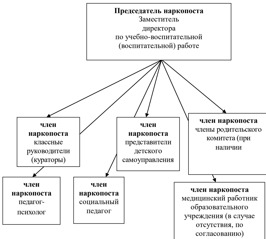
Рис. 1. Состав наркопоста

3) В состав наркопоста входят: заместитель директора по учебно-воспитательной (воспитательной) работе, социальный педагог, медицинский работник образовательного учреждения, педагог-психолог, классные руководители (кураторы), представители детского самоуправления, члены родительского комитета (при наличии) (Рис.1).