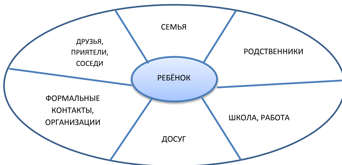
Карта социальных связей