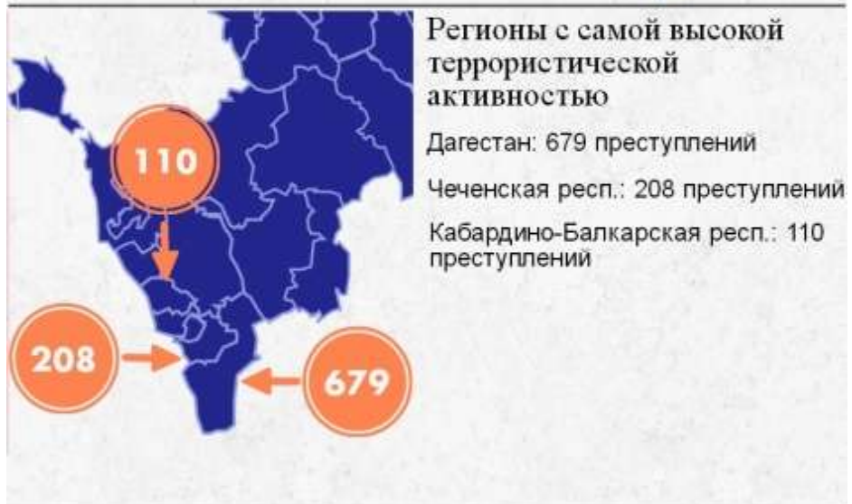
Статистика преступлений террористической направленности в 2015 г.